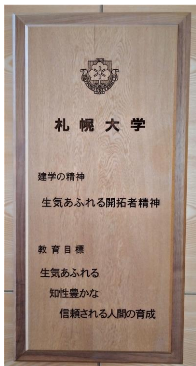
【図表 1-2-1 木製パネル】